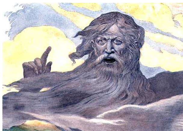
Emil Doepler «Il gigante Ymir»

Nella Scienza dello Spirito si parla di una biografia organizzata in sette parti e, in questo senso, si mostra anche che s'intende concepire l'uomo come un piccolo mondo proiettato nel passato di un'epoca cosmica anteriore e che indica una futura evoluzione. Così, egli è nato dall'universo, non soltanto dal passato; al contrario, in tutta la sua evoluzione egli ha anche qualche cosa di profetico che indica un'epoca futura. E quello che vi è presupposto avviene da oggi nella biografia dell'uomo. Perciò non è affatto insensato dire che l'uomo arrivi a conoscere veramente il suo Io