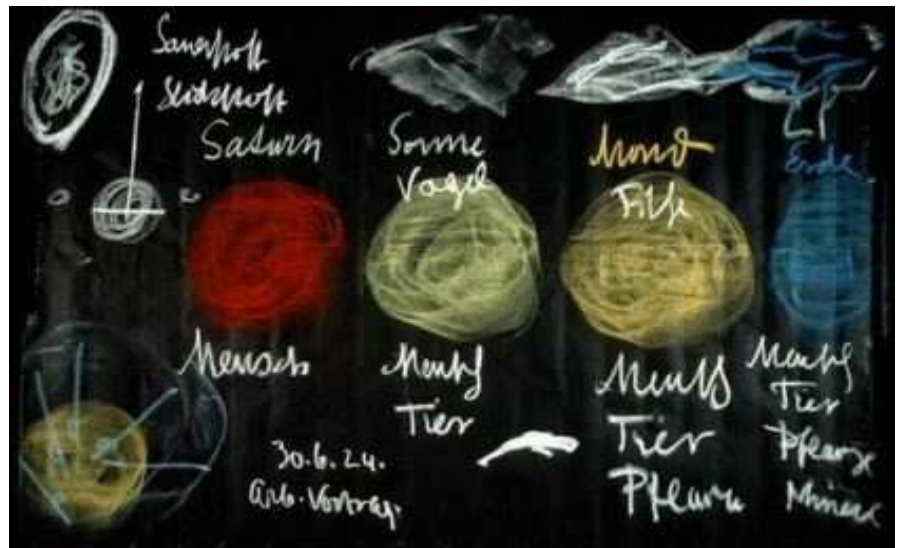
Rudolf Steiner «I primi quattro stadi evolutivi della Terra» (disegni alla lavagna – 1924)

Questo Sole si è d’altronde sviluppato a partire da un pianeta situato così lontano nel tempo che l’attuale umanità può molto difficilmente farsene un’idea. Questo pianeta è chiamato “Saturno”. Saturno si è evoluto per diventare Sole, il Sole per diventare Luna, la Luna per diventare Terra, la Terra evolverà per divenire “Giove”, Giove per divenire “Venere” e Venere per diventare un pianeta che si designa con il nome di “Vulcano”.