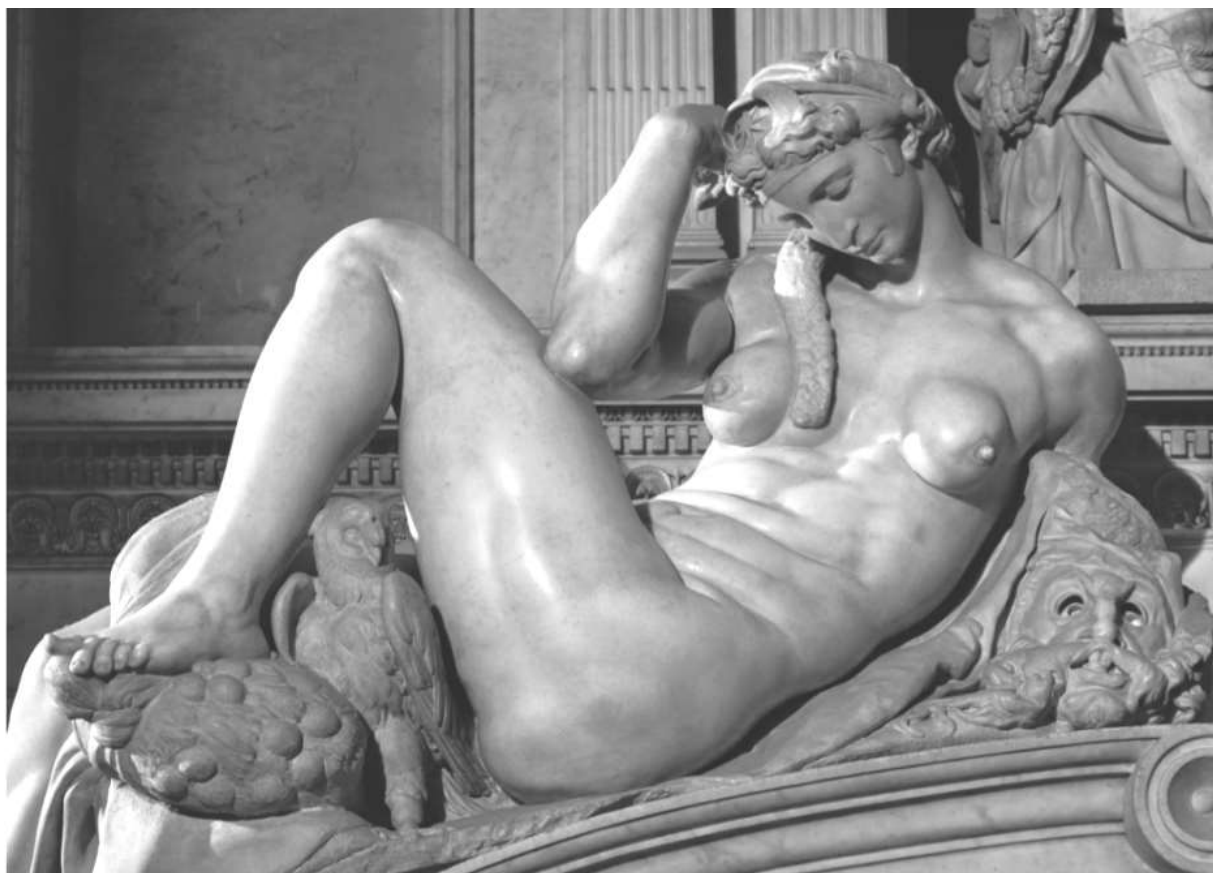
Michelangelo – La Notte. Cappelle Medicee, Firenze.

Così la scienza dello spirito sarà ciò che non ha bisogno di sottolineare continuamente la cura esteriore dell'amore umano universale, e invece concepirà questo amore umano nella vita dell'anima dell'uomo, grazie ad una giusta e autentica conoscenza.